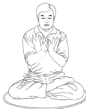
Lotusov položaj rok