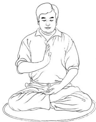
Držanje pokončne dlani